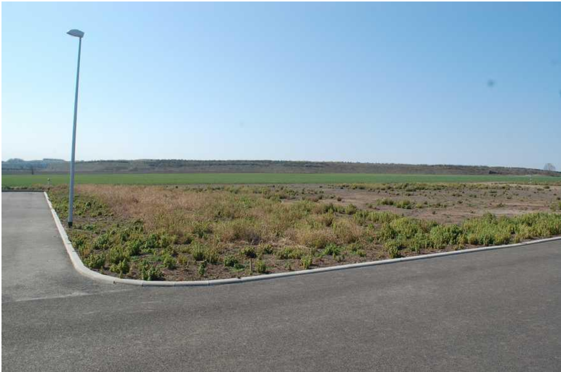
příjezdová komunikace - okolí